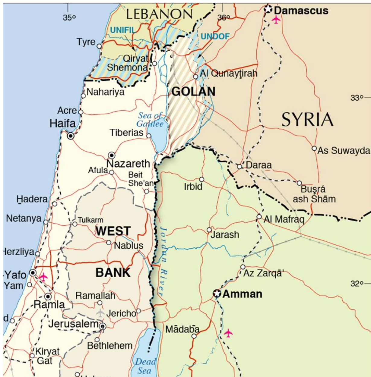
Figuur 4: Nationsonline, Map of Israel 86

Onderstaande kaart geeft een geografische weergave van de grensstreek met Israël en de zuidelijke provincies van Syrië