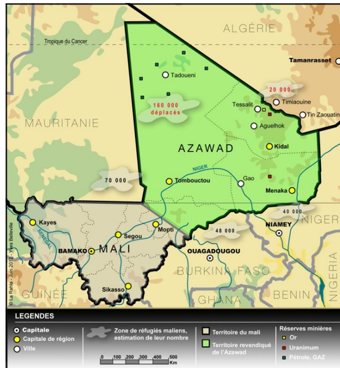
Mali – Deux nouvelles régions au nord (Taoudénit et Ménéka) depuis 2012 25

Le 14 septembre 2017, des militaires de la garde nationale ont été attaqués à Ménéka par des inconnus qui ont pris la fuite au volant d'un véhicule de l'armée. Deux soldats ont été tués et un autre blessé, un quatrième est porté disparu. Radio France internationale (RFI) indique qu'il s'agit de la deuxième attaque de ce type depuis le début du mois de septembre à Ménéka 26 .